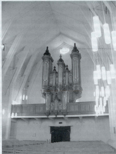
KOBE SHOIN WOMEN'S UNIVERSITY CHAPEL

The Shoin Women's University Chapel was completed in March 1981. It was built with the intention that it should become the venue for numerous musical events, in particular focusing on the organ. The average acoustic resonance of the empty chapel is approximately 3-8 seconds, and particular care has been taken to ensure that the lower range does not resound for too long. Containing an organ by Marc Garnier built in the French baroque style, the chapel houses concerts regularly.