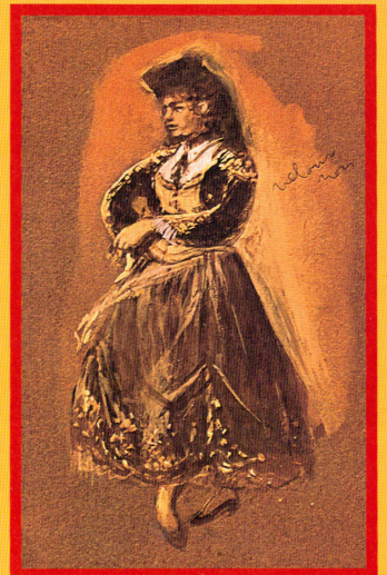
Lila de Nobili: Carmen costume design

Vienna State Opera Chorus Vienna Boys Choir