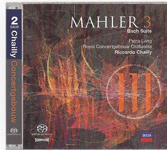
mahler: symphony no.3 rcoa/riccardo chailly SACD 470 652-2