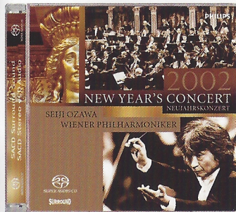
new year's day concert wp/seiji ozawa SACD 470 615-2

Printed in Germany/Imprimé en Allemagne · Made in Germany