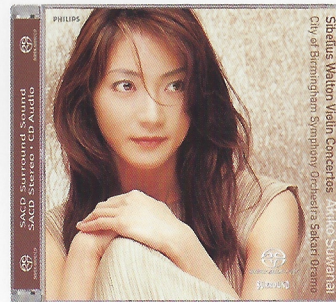
sibelius · walton: violin concertos akiko suwanai/cbso/sakari oramo SACD 470 622-2