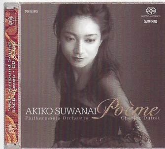
poème — saint-saëns, ravel, etc. akiko suwanai/po/charles dutoit SACD 470 6189