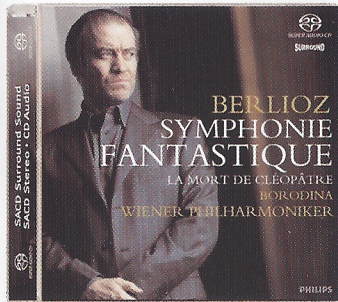
berlioz: symphonie fantastique, etc. wp/valery gergiev SACD 470 632-2