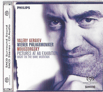
moussorgsky: pictures at an exhibition, etc. wp/valery gergiev SACD 470 619-2