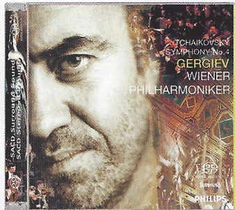
tchaikovsky: symphony no.4 wp/valery gergiev SACD 475 6196