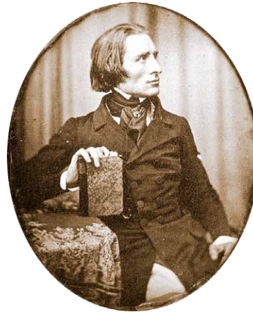
Franz Liszt, 1843 Daguerreotype by Hermann Biow

number, quasi attacca. You can even think of Mazeppa as a brother to the contemplative landscape of no. 3, and no. 6 as a gravity-filled reaction to the flickering, weightless lights of no. 5. It's important for me to play around with these pairings, in terms of the musical drama and contrast they create, and how they cumulatively create the trajectory of the entire cycle.