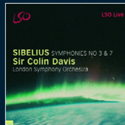
Sibelius Symphonies Nos 3 & 7 Sir Colin Davis conductor CD (LSO0051) SACD (LSO0552) or download

Choc de l'année 2007 Le Monde de la Musique (France)