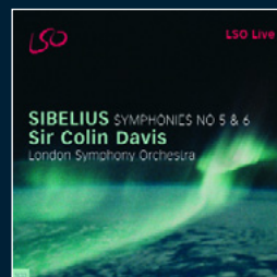
Sibelius Symphonies Nos 5 & 6 Sir Colin Davis conductor CD (LSO0037)

'Stunning ... Flawless' Disc of the month Classic FM Magazine (UK)