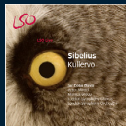
Sibelius Kullervo Sir Colin Davis conductor CD (LSO0074) SACD (LSO0574) or download

'Stunning ... Flawless' Disc of the month Classic FM Magazine (UK)