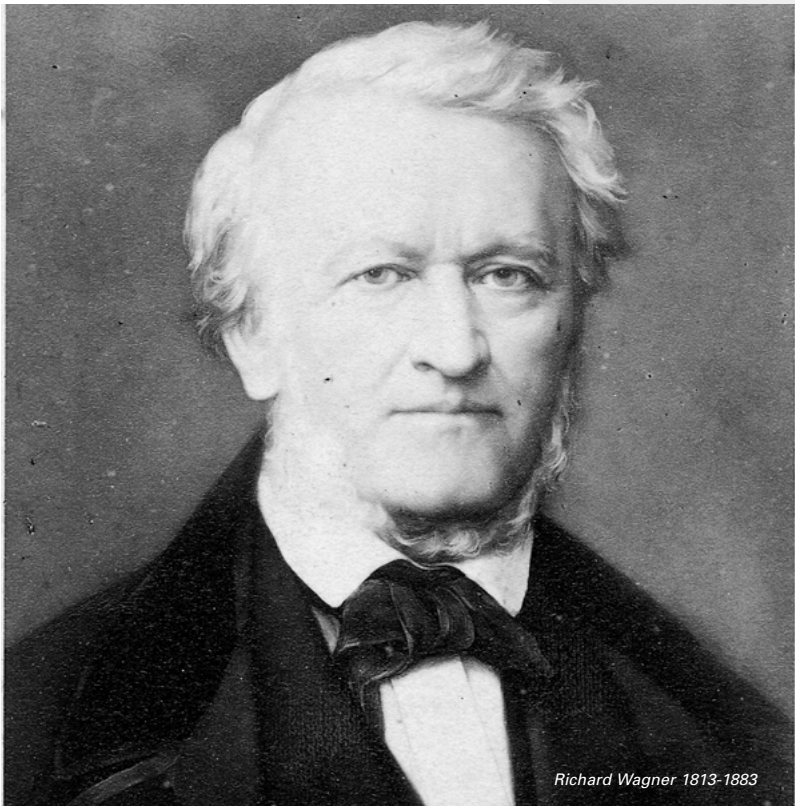
Richard Wagner 1813-1883